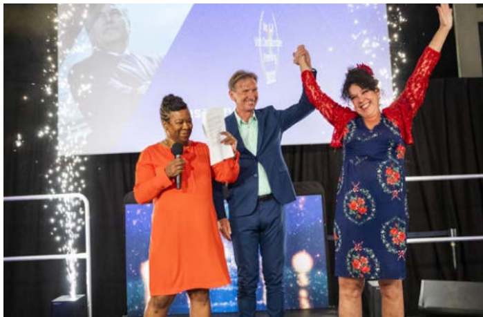
De oprichters en directie van Theater Walhalla zijn op 17 mei onderscheiden met de Mr. K.P. Van Der Mandele Penning, voor verantwoordelijk ondernemerschap. "De prijs is hen toegekend vanwege hun creatieve culturele ondernemerschap waarbij duidelijk is dat zij geen ondernemers zijn met winstmaximalisatie voor ogen maar maatschappelijk nut maximalisatie".