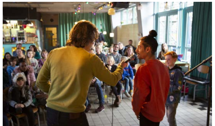
Tussen Kunst en Kids