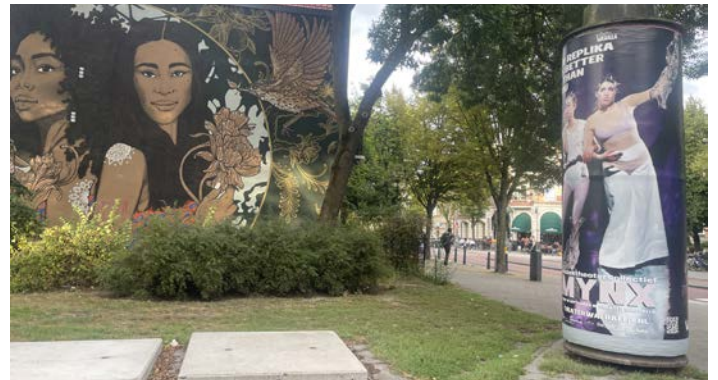
Poster Mynx in de stad

Instagram en Facebook zijn de belangrijkste kanalen, gevolgd door LinkedIn, TikTok en YouTube. Instagram groeide naar 9.558 volgers. Instagram en Facebook worden vooral gebruikt voor beeld en updates, LinkedIn voor zakelijke communicatie en YouTube voor trailers.