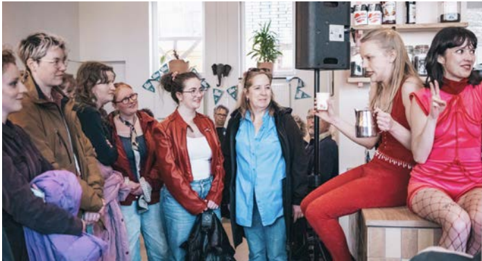
Café Theater Festival 2025