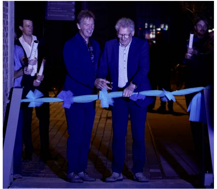
Opening Metro Walhalla

De bouw van Metro Walhalla was technisch en financieel complex. Bezwaarprocedures van omwonenden en stijgende bouwkosten zorgden voor extra uitdagingen. Dankzij de inzet van diverse fondsen en particuliere donateurs kon de zaal uiteindelijk gerealiseerd worden.